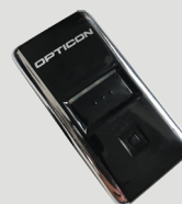
Bluetooth-Scanner 150,- €* (Selbstkostenpreis)